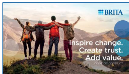
Kodeks postępowania dla pracowników